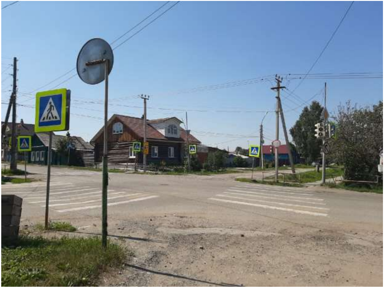
Регулируемый перекресток ул. Щорса и ул. Логинова