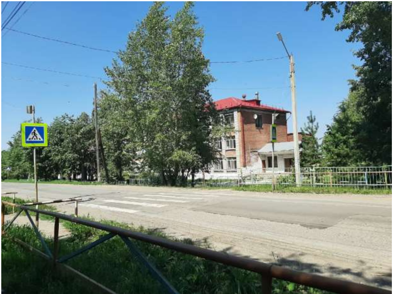
Пешеходные переходы, обозначены знаками и разметкой