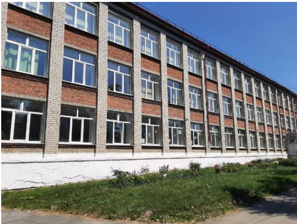
Фото фасада здания

Местоположение школы требует от учащихся особого внимания при переходе проезжей части дороги на пути следования в школу и обратно, поэтому вопрос изучения ПДД и привития навыков правильного поведения детей на улицах является одним из основных в деятельности педагогического коллектива.