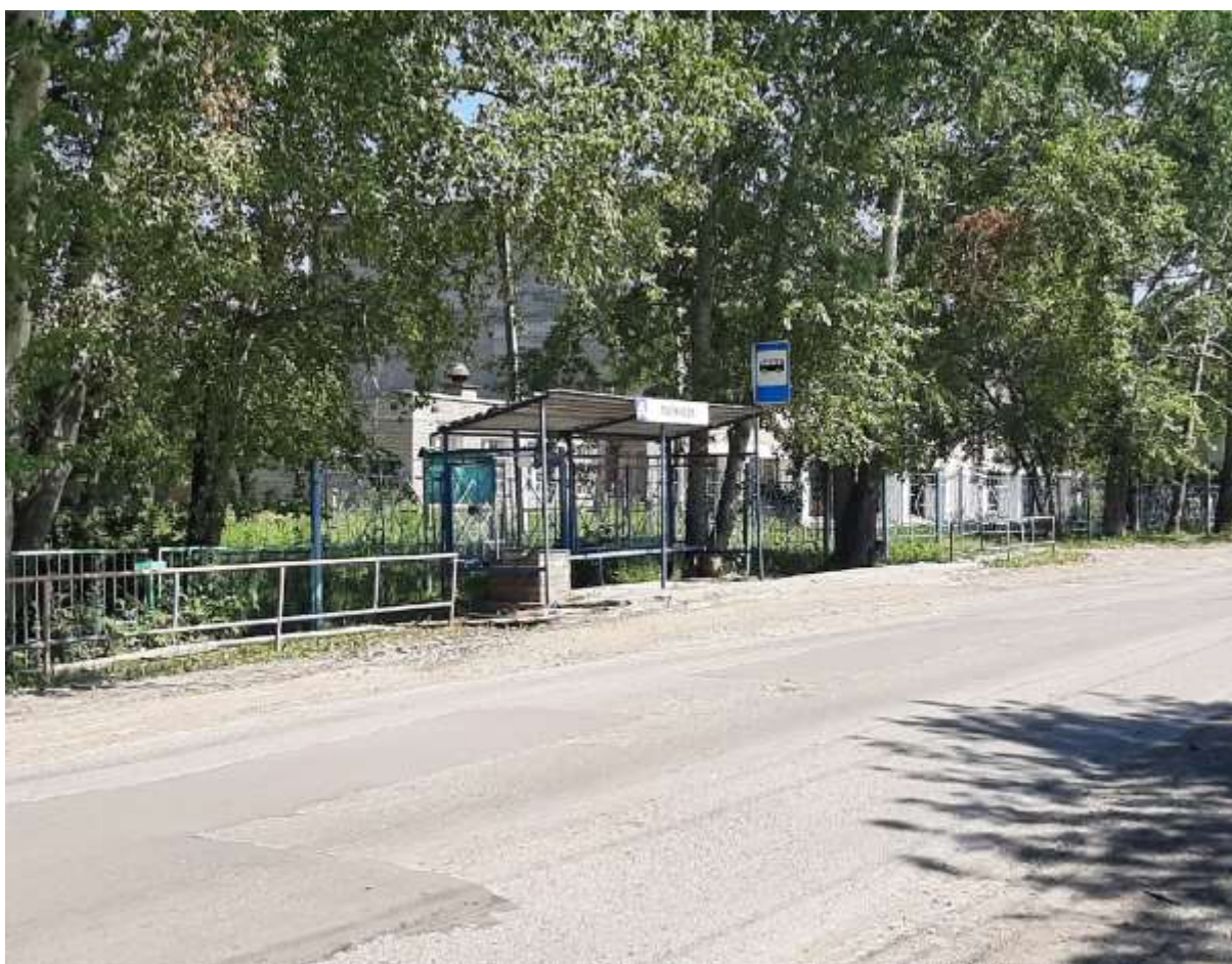
Автобусные остановки, ул. Логинова